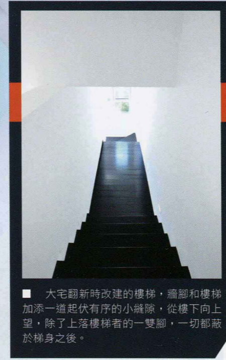
大宅翻新時改建的樓梯，牆腳和樓梯加添一道起伏有序的小縫隙，從樓下向上望，除了上落樓梯者的一雙腳，一切都藏於梯身之後。