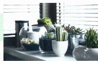
植物綠化 綠色植物給室內帶來大自然氣息。

現時大部分新落成的樓宇皆注重綠化，以環保建築概念，在設計、建造及物料使用上，都更加符合環保及經濟原則。在照明方面，LED燈光線穩定又節能，早已廣泛應用於各個家庭。選用有吸收二氧化碳功效的油漆塗料，有助改善空氣質素；另有採用粟米、木薯等天然植物成分作原料的高科技環保漆，取代部分石油衍生物，有助打造綠化家居。窗戶安裝Low-E玻璃，它是塗有鍍膜層的複層玻璃，可反射紫外線與紅外線，有效隔熱，玻璃保持透明色，具良好採光性，獲得愈來愈多樓宇採用。